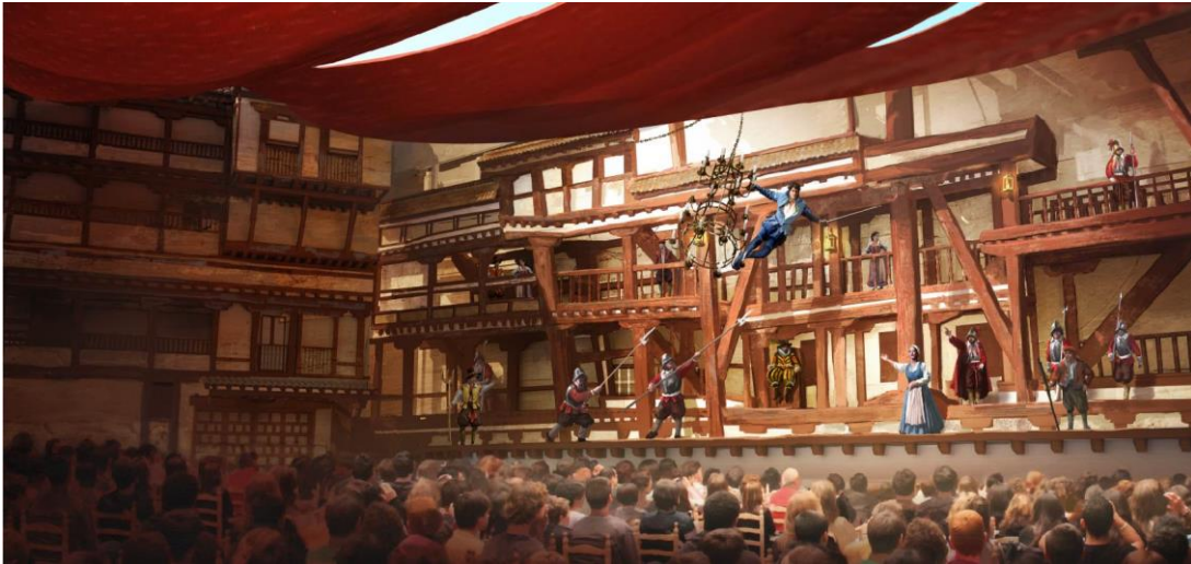
A Pluma y Espada