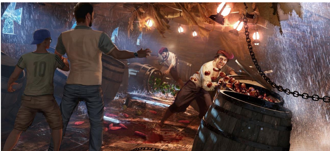
Allende la Mar Oceana

Tras una última entrevista con la Reina Isabel y los preparativos en el Puerto de Palos, el visitante está invitado a embarcar como tripulante de la nao Santa María para vivir en primera persona la gran expedición en la búsqueda de una nueva ruta a las Indias. Por medio de este espectáculo inmersivo, compartirá las esperanzas y grandes angustias de una tripulación épica hasta poder gritar: “¡TIERRA!”