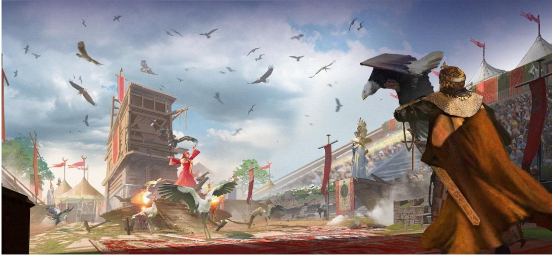
Cetrería de Reyes

Una exhibición aérea sin precedentes, que permitirá sentir a muy pocos metros a majestuosas aves que desplegarán sus imponentes alas y transmitirán al visitante amor por la naturaleza y ganas de volar.