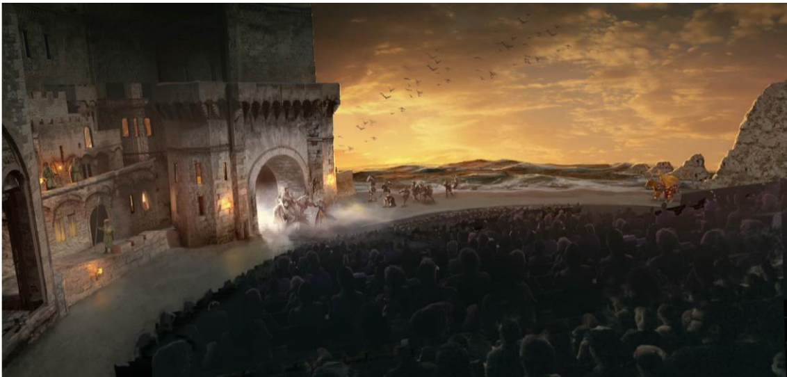
El Último Cantar

En un insólito teatro nunca visto en nuestro país, el visitante vivirá grandes emociones al seguir las hazañas espectaculares de una gran figura de leyenda