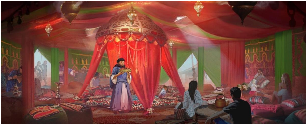
El Askar Andalusi

El espléndido campamento califal ha sido erigido a las puertas de las gradas del espectáculo “Cetrería de Reyes”. En este conjunto de coloridas jaimas, se dan cita los mejores artesanos del cuero y del damasquinado, recién llegados de Medina Azahara. El Askar es, además, un lugar donde descubrir platos típicos de la gastronomía omeya.