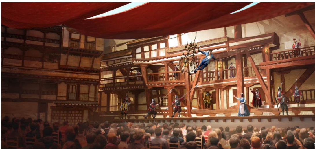
A Pluma y Espada

El visitante quedará deslumbrado por la gran aventura de este brioso espadachín y autor de leyenda; así como por las monumentales coreografías de los caballos andaluces y bailarinas toledanas.