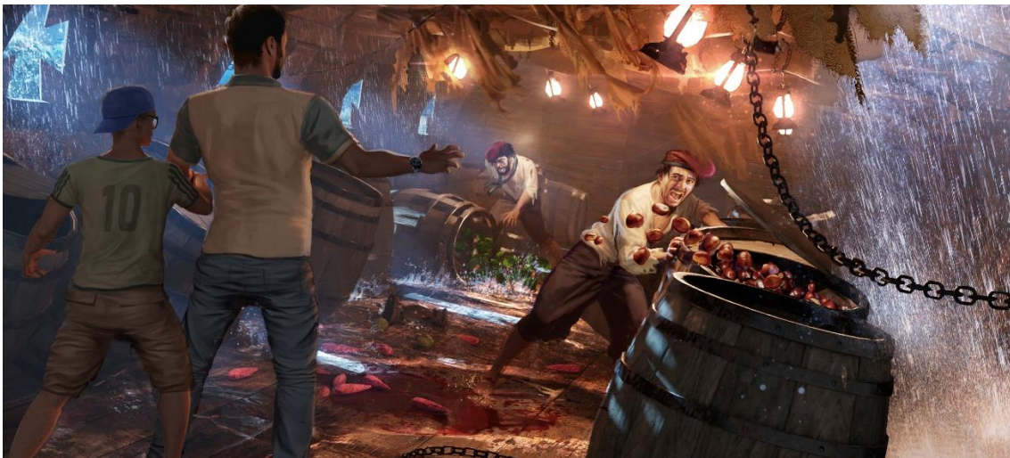
Allende la Mar Oceana

Tras una última entrevista con la Reina Isabel y los preparativos en el Puerto de Palos, el visitante está invitado a embarcar como tripulante de la nao Santa María para vivir en primera persona la gran expedición en la búsqueda de una nueva ruta a las Indias. Por medio de este espectáculo inmersivo, compartirá las esperanzas y grandes angustias de una tripulación épica hasta poder gritar: “¡TIERRA!”