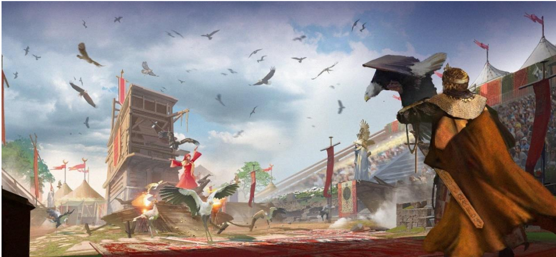
Cetrería de Reyes